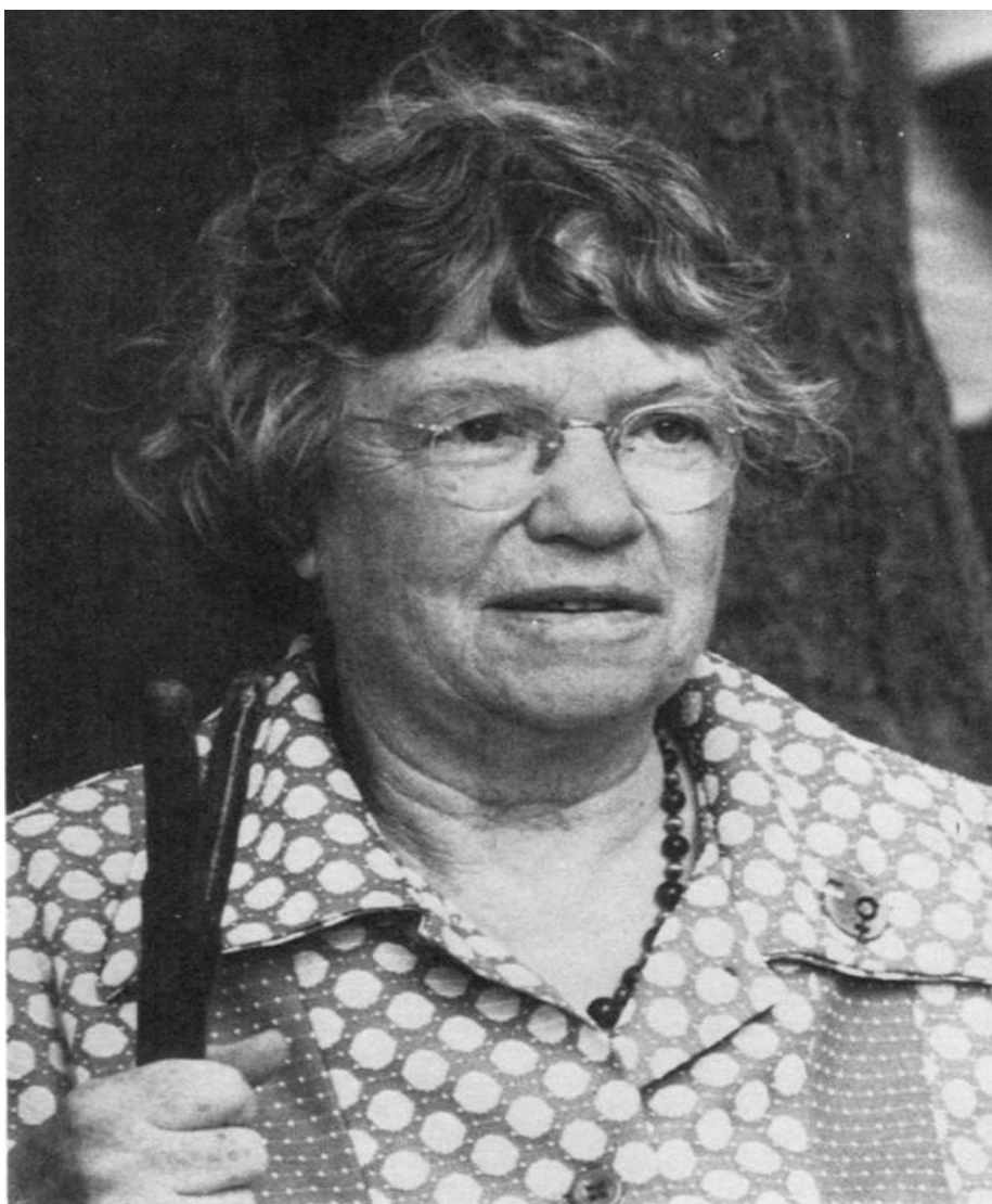
Obrázek č. 3: Margaret Meadová v roce 1976.