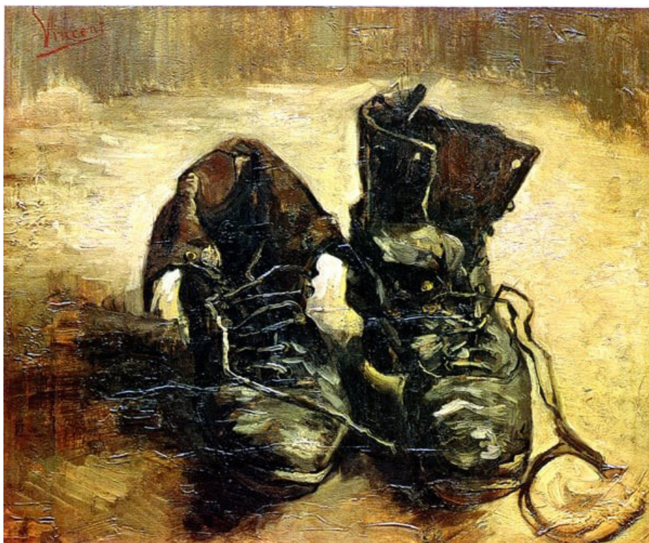
Obr. 1. Vincent van Gogh, Boty. Dostupné z: https://commons.wikimedia.org/wiki/File:Schoenen_-_s0011V1962_-_Van_Gogh_Museum.jpg , cit. 2025-11-21 (veřejná doména)