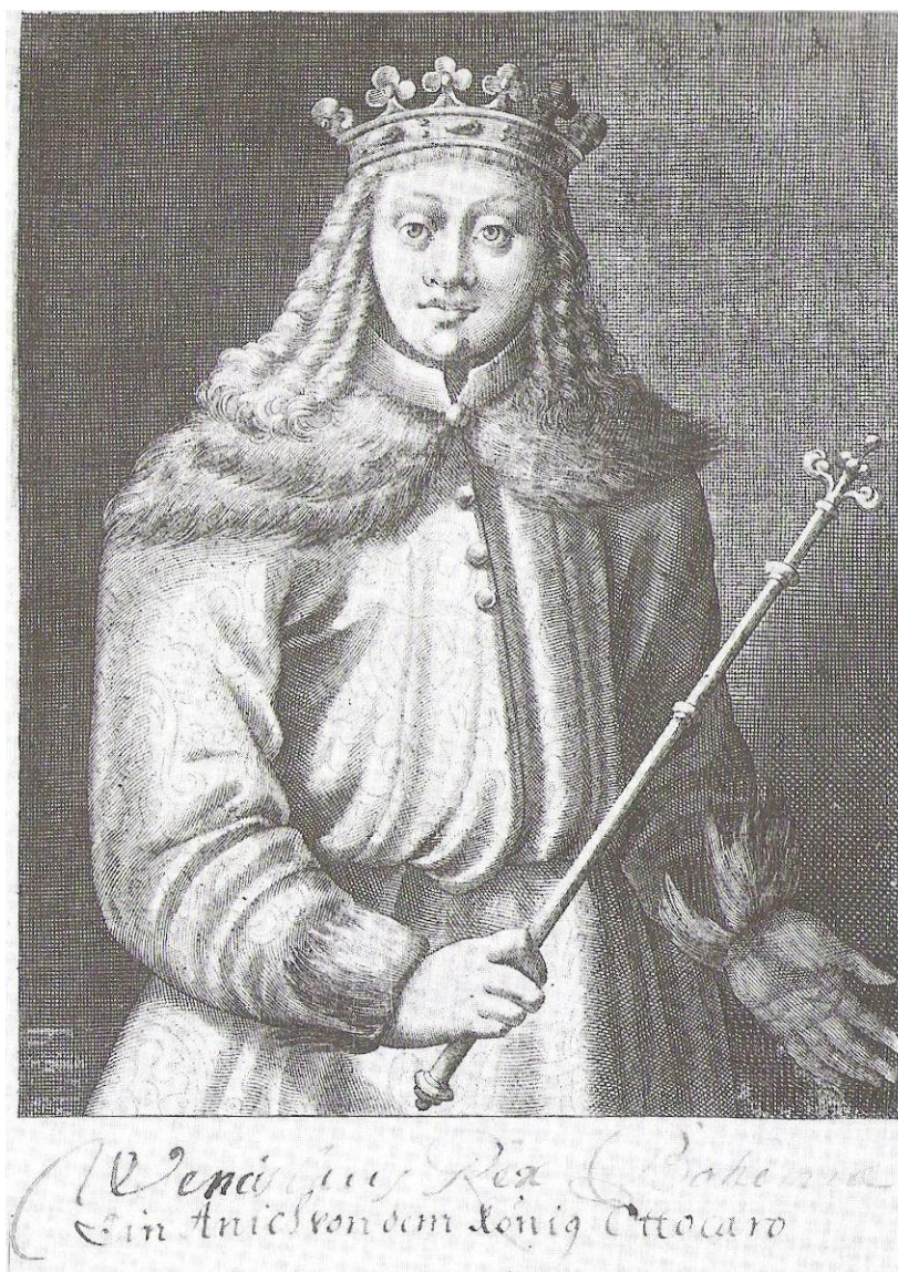
Příloha č. 5, Fiktivní portrét krále Václava III.

Zdroj: MARÁZ, Karel. Václav III. (1289–1306) . České Budějovice: Veduta, 2007, s. 88.