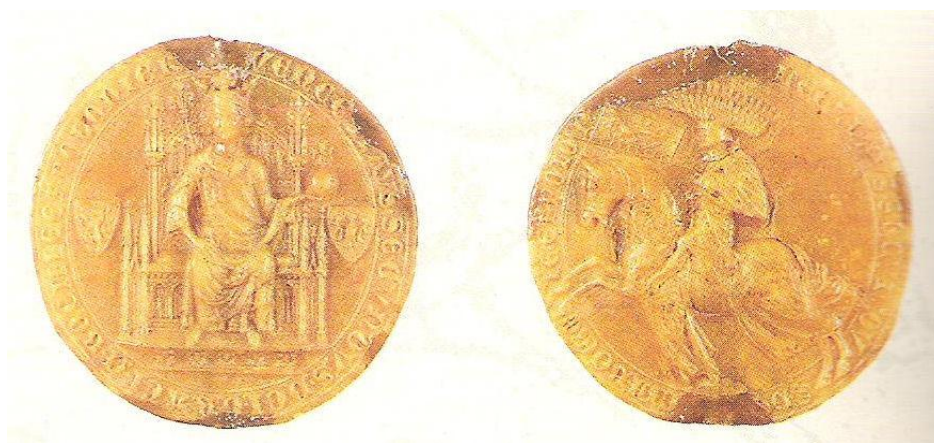
Příloha č. 3, Pečeť krále Václava II., III.