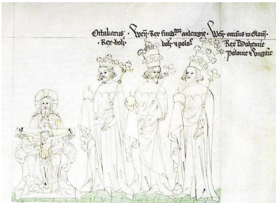
Příloha č. 1, Opis Zbraslavské kroniky z roku 1393. Tento rukopis zachycuje fiktivní portréty posledních Přemyslovců.