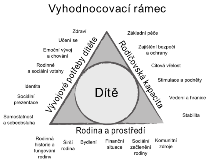
Obrázek 2 – Vyhodnocovací rámeček